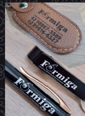
Brindes em Geral