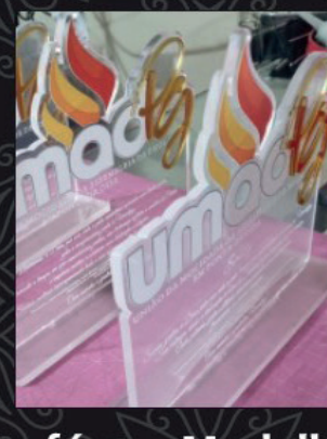
Troféus e Medalhas em Acrílico